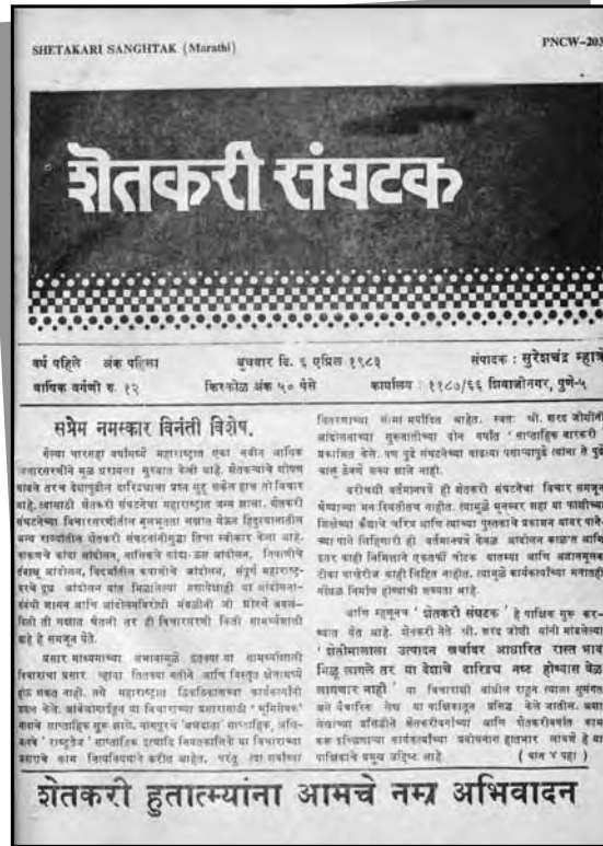
शेतकरी संघटकच्या पहिल्या अंकाचे प्रथम पृष्ठ