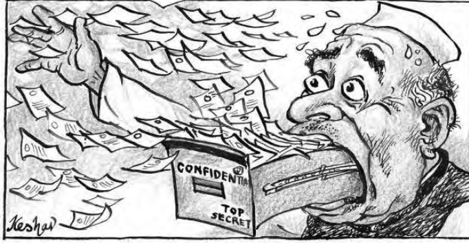
(सौजन्य : दे. हिंदू, व्यंगचित्रकार- केशव)

या साऱ्या आरोप - प्रत्यारोपांत न जाता या सर्वांच्या मुळाशी जाऊन पाहिले, तर एक बाब सूर्यप्रकाशाइतकी स्पष्ट आहे - जवळजवळ ९५ टक्के वाचकांनी 'विकिलिक्स'वर पूर्णतः विश्वास व्यक्तकेलेला दिसतो. राजकीय नेत्यांनी - मग ते कोणत्याही पक्षाचे असोत - त्यांच्या खुलाशाला कोणीही भीक घातलेली नाही. 'अमेरिकी केबल्स'च्या हेरगिरीवर आणि त्या आधारावरील 'विकिलिक्स'च्या हेरगिरीवर कोणीही अविश्वास दाखवीत नाही, हे चित्र भारतीय अथवा अमेरिकी या दोन्ही देशांतील राजकारण्यांसाठी नक्कीच चिंता करण्याजोगे आहे. हा विश्वास ठेवण्यामागे किंवा वाढीस लागण्यामागेही एक कारण आहे. नगरसेवक, आमदार खासदारपदी निवड झाल्यानंतर अल्पावधीतच त्यांच्या प्रॉपर्टी ज्या वेगाने वाढतात ते समाज उघड्या डोळ्यांनी पाहतो आणि आपले तोंड बंद ठेवतो. एखाद्यावर 'उत्पन्नाच्या तुलनेत अधिक मालमत्ता जमविल्याच्या