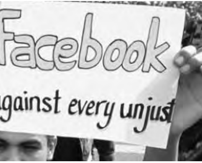
गान झळकलेले बॅनर