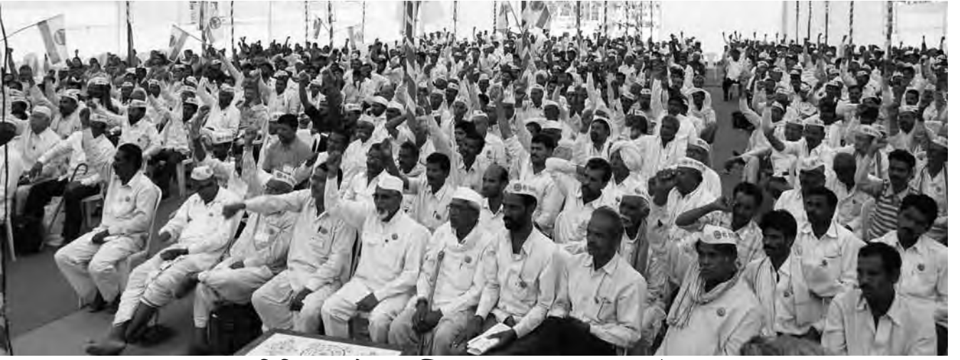
प्रतिविधानसभेस उपस्थित सन्माननीय आमदार मंडळी