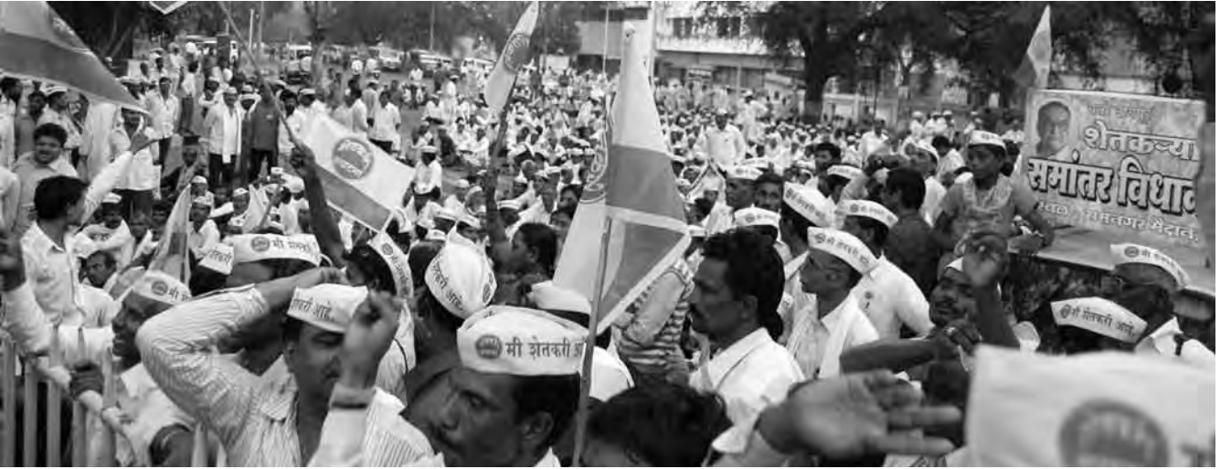
रामगिरीसमोर ठिय्या देऊन बसलेले शेतकरी कार्यकर्ते